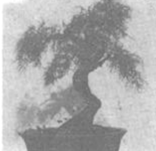
黄河口之春