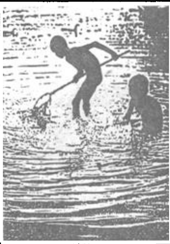
黄河口文化 刊头题字：李建华

在黄河口地区生长着大片大片的黄须菜，这是一种野生植物，耐盐碱，抗干旱，生命力极强。鲜嫩的菜叶还是一种美味凉菜，有东营市市菜之美称。初春，当万物刚刚开始萌动时，它已早早给大地盖上一层新绿。深秋，黄须菜又给大地披上了红装，极目远望，象火海，似朝霞，让人心醉。节假日，这里便成了姑娘小伙儿郊游的乐园，一对对热恋的情侣都扑向这充满幸福和吉祥的红草地，陶醉在这大自然赐予的绚丽世界里。